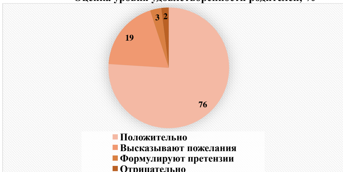
Оценка уровня удовлетворенности родителей, %

Общие результаты по итогам оценки уровня удовлетворенности родителей представлены в гистограмме ниже.